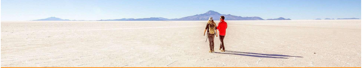
Unterwegs auf dem Salar de Uyuni