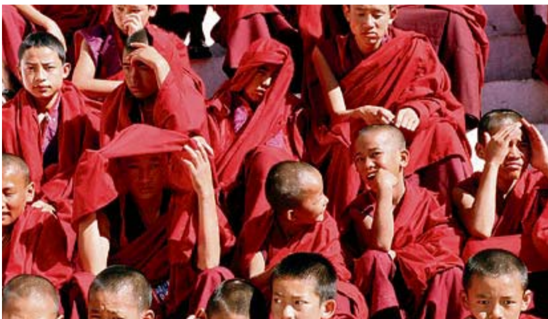
Klosternovizen in Thimpu: Nach dem Beten erfreut sich die Jungschar an iPod und «Harry Potter» auf DVD