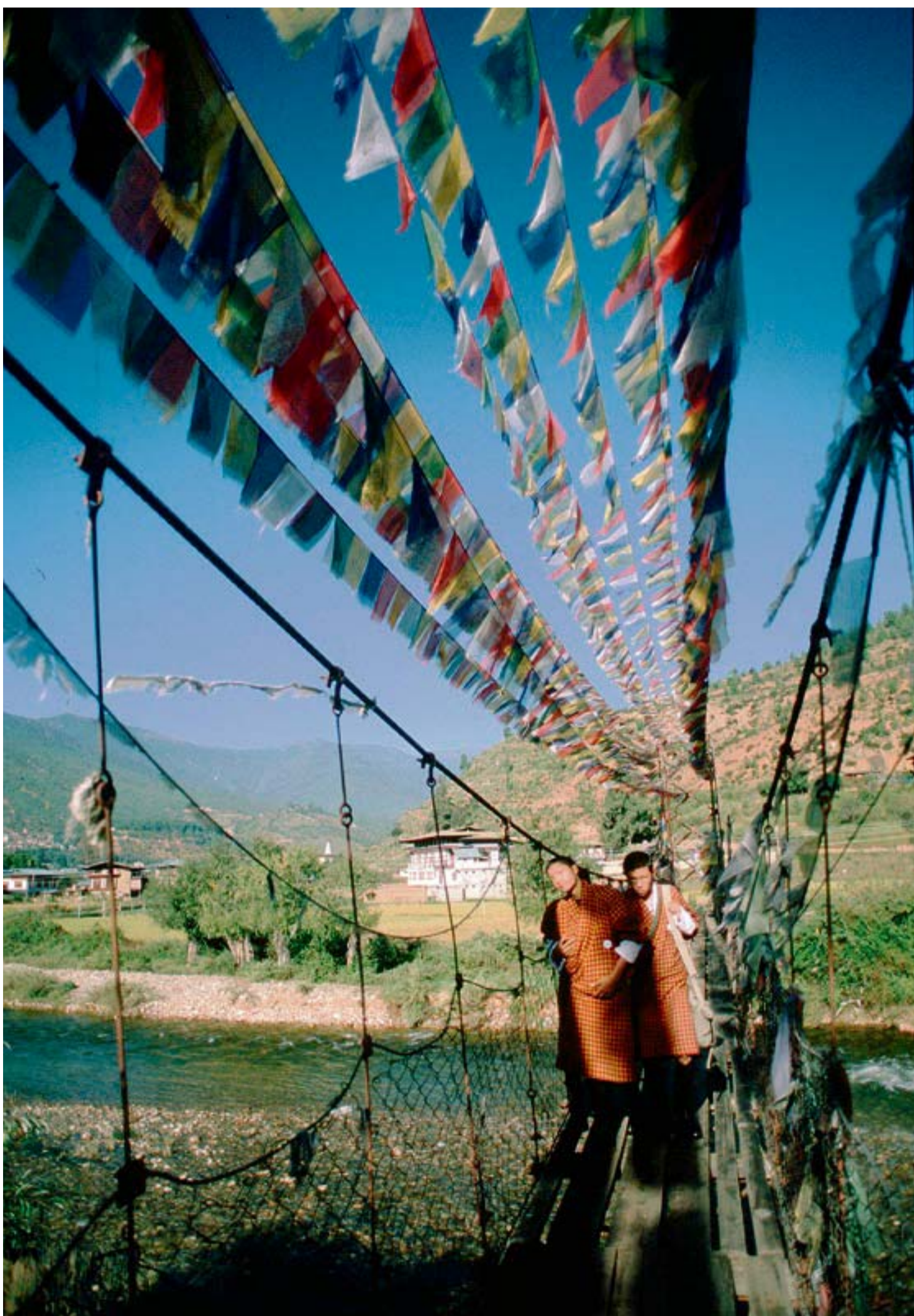
Gebetsfahnen am Paro-Fluss: Noch zwingt ein Gesetz die Bhutaner, im Alltag ihre Nationaltracht – den knielangen Kho – zu tragen