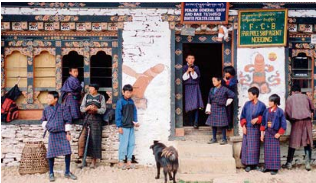
Schüler vor einem Tante-Emma-Laden: Phallusse an den Wänden sollen das Haus vor Dämonen schützen