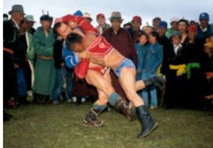
Wer im traditionellen Ringkampf siegt, muss danach einen Adlertanz vorführen.

Stutenmilch ist gesund, für westliche Gaumen aber gewöhnungsbedürftig.