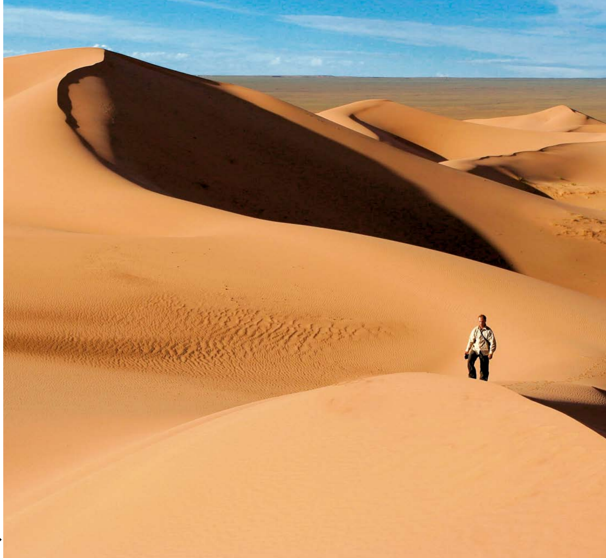
Die Düne von Chongoryn Els schlägt den Besucher mit ihrem Singen in Bann.