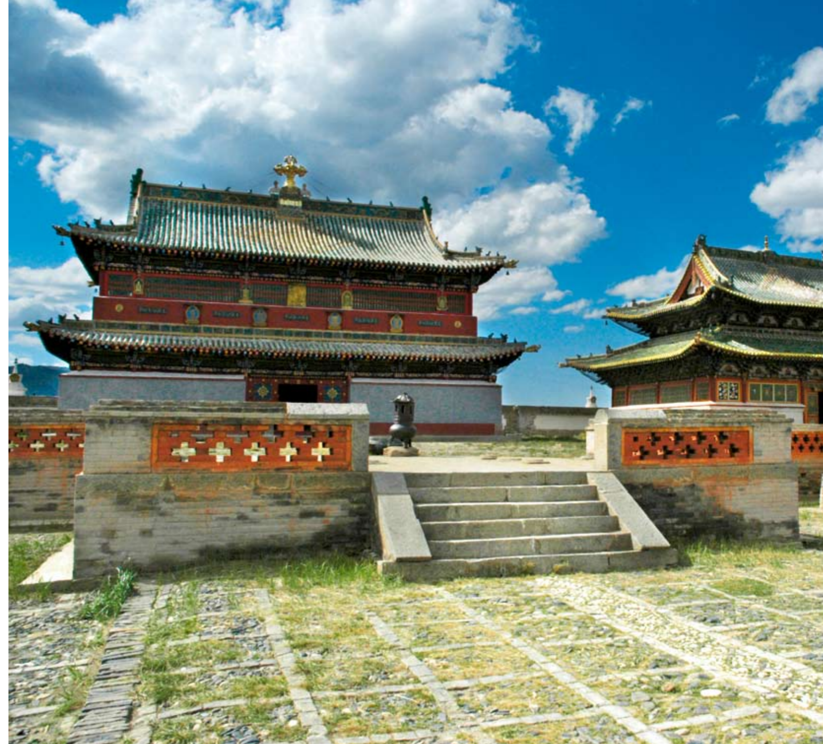
In Karakorum, der ehemaligen Hauptstadt von Dschingis Khan, steht Erdene Zuu, das grösste buddhistische Kloster der Mongolei.

Das Rundzelt ist dem Klima perfekt angepasst. Im Winter werden zusätzliche Schichten Filz aufgelegt und der Ofen eingheizt, der auch zum Kochen dient. Im Sommer hebt man den Saum des Zeltes und erhöht die Luftzirkulation. Der Aufbau der Ger widerspiegelt die mongolische Vorstellung vom Kosmos. Die Tür ist immer gegen Süden gerichtet, im Norden, also hinten im Zelt, befindet sich der Hausaltar, und in der Mitte, wo der Ofen steht, gibt es ein unscheinbares Heiligtum: Wehe dem, der Abfall in die Kiste mit dem Pferde- oder Yakdung wirft. Die Stimmung sinkt dann auch im Sommer unter