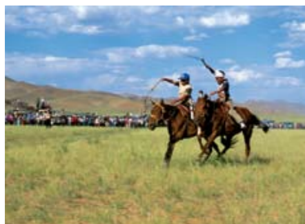
Am Nationalfeiertag Naadam liefern sich Kinder wilde Pferderennen.

Stutenmilch ist gesund, für westliche Gaumen aber gewöhnungsbedürftig.