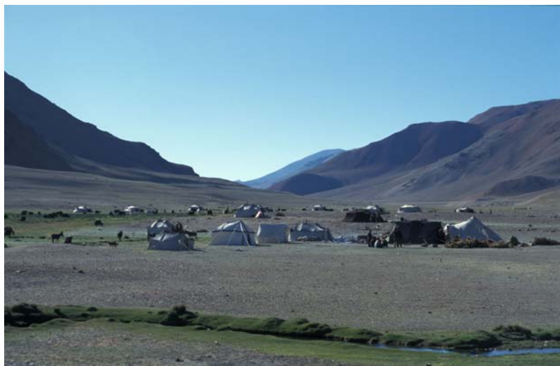
Nomadencamp an der Quelle von Pangunagu, Rupshu-Hochplateau