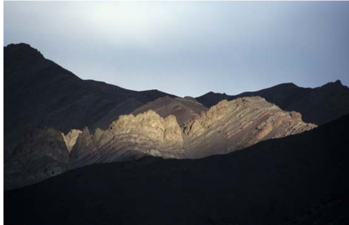
Lichtstimmung in Ladakh