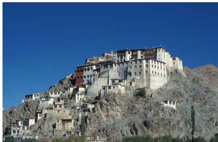
Kloster von Spituk, nahe Leh im Industal