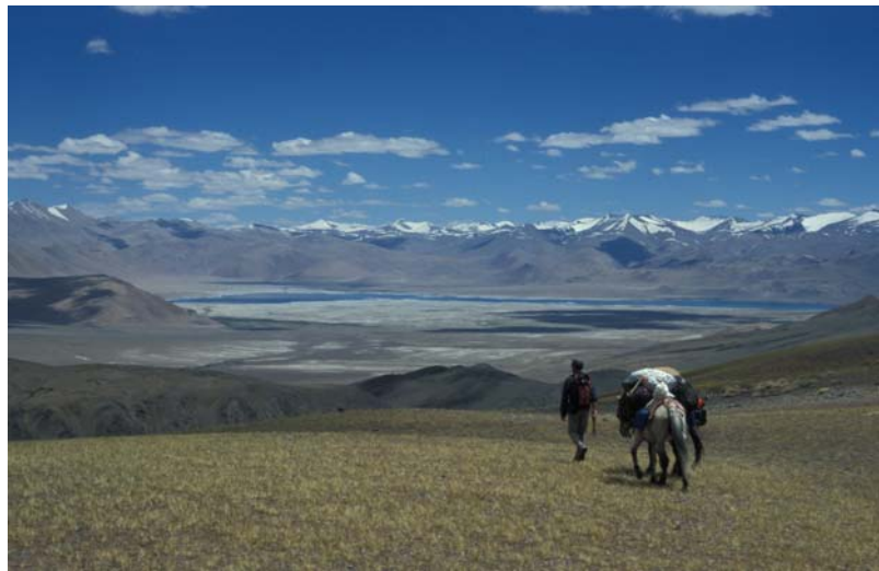
Auf dem Rupshuhochplateau (4500-6000 Meter), in der Ferne der Salzsee Tsokar