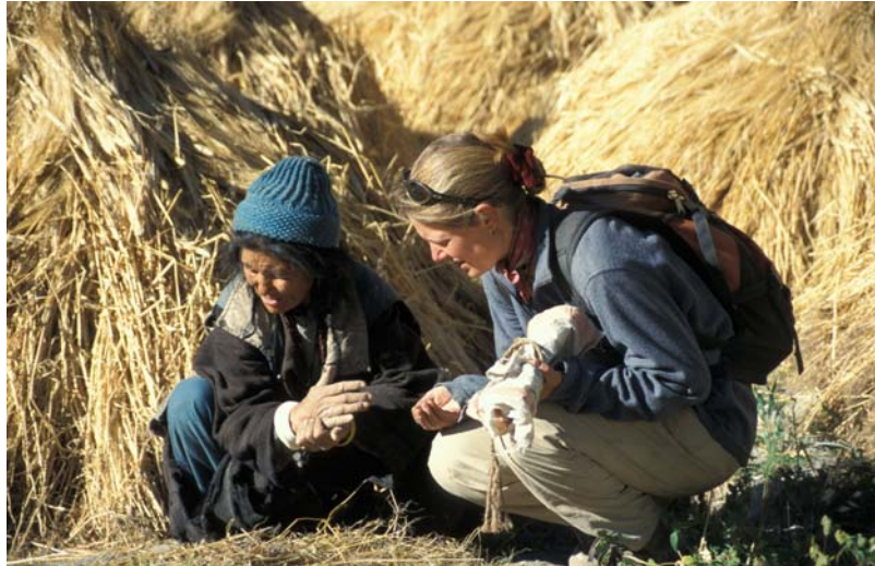
Feilschen um den Preis und die Qualität der Gerste, wei immer Rupie 15 pro Kilo