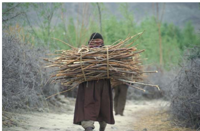
Holz ist Mangelware in Ladakh