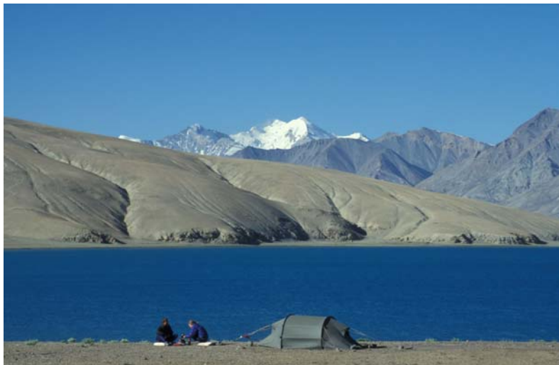
Einsamer Zeltplatz am Tsomoriri-See