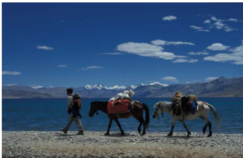
Vor dem Salzsee Tsomoriri